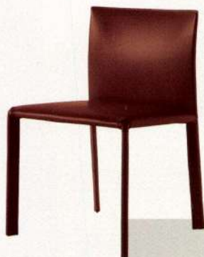
Blyn stol af Oscar og Gabriele Buratti, 5.580 kr. (Frag).

Pop Etna kalder italienske PLAC&E deres design af seks tæpper inspireret af flydende lava og den altid sydende aktivitet i landets vulkaner og udfordrer med kollektionen The Floor is Lava konventionelle former og mønstre i tæppeland (Carpet Edition).