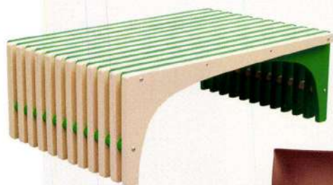
Arc sofabord, 10.789 kr. (Zachary Frankel).