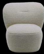
Loil Design Paola Navone, Gervasoni