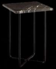
Arcadia Design Grazia Stasi, Gironi 1735