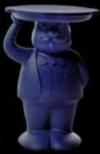
Ambrogio Design Favre&Partners, Sicte