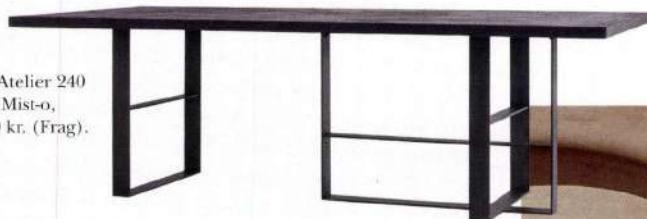
Bord Atelier 240 af Mist-o, 32.100 kr. (Frag).

Med et miks af rå stenflader og blankpoleret belsning har den Barcelona-baserede tegnstue Arquitectura-G skabt de nye rammer for Acne Studios-butikken i Stockholm, som oprindeligt rummede en bank. Det perfekte backdrop til en shoppetur (Acne Studios).