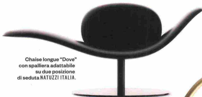
Chaise longue "Dove" con spalliera adattabile su due posizioni di seduta NATUZZI ITALIA.