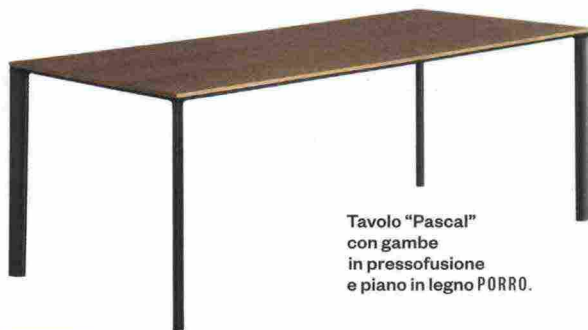
Tavolo "Pascal" con gambe in pressofusione e piano in legno PORRO.