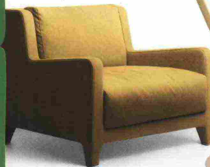
Poltrona comfort "Alma", sagomata in stile anni Quaranta LEMA.