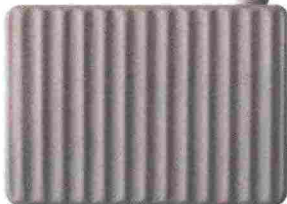
Appliche "Umarèll" in ceramica opaca e sorgente LED KARMAN.