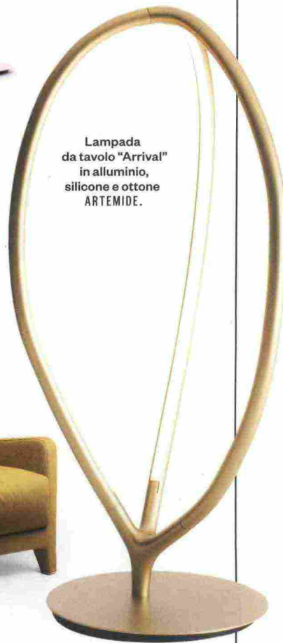
Lampada da tavolo "Arrival" in alluminio, silicone e ottone ARTEMIDE.