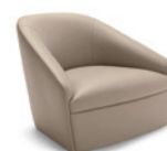
Hollow FG 482.01