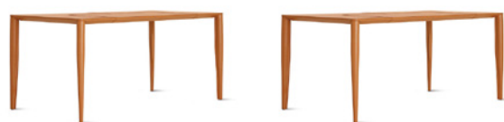
Dante 150 FG 366.00