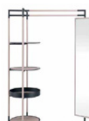
Bak Miror FG 440.01