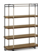
Bak Bookcase FG 440.10