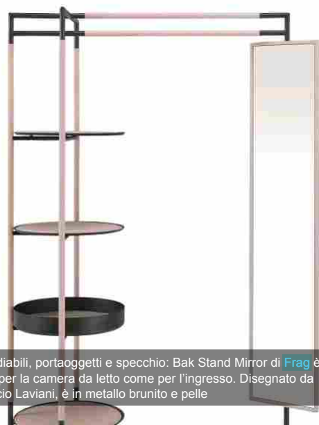
Appendibili, portaoggetti e specchio: Bak Stand Mirror di Frag è adatto per la camera da letto come per l'ingresso. Disegnato da Ferruccio Laviani, è in metallo brunito e pelle