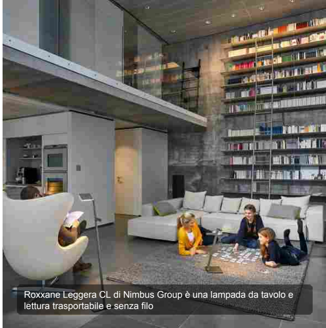
Roxxane Leggera CL di Nimbus Group è una lampada da tavolo e lettura trasportabile e senza filo

Per i Millennials la casa è flessibile, dinamica e in continua trasformazione , quindi anche i mobili devono esserlo per adeguarsi alle esigenze in evoluzione . Qualche esempio? Divani che cambiano forma, che non significa il tradizionale divano-letto, ma una seduta composta da grandi cuscini che si spostano per creare configurazioni diverse in base alle necessità. Arredi che hanno più funzioni, come poltrone che diventano un tavolino, oppure che si possono trasferire da una stanza all'altra o da una casa all'altra adattandosi ai diversi contesti. Ne sono esempio le lampade wireless, senza filo e non vincolate dalla presa elettrica, che si spostano dove si preferisce, anche fuori casa. Mobili in cartone leggeri e flessibili, apparentemente precari, ma pratici da montare in totale fai-da-te e, ovviamente, smontabili e trasferibili.