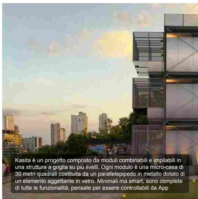
Kasita è un progetto composto da moduli combinabili e impilabili in una struttura a griglia su più livelli. Ogni modulo è una micro-casa di 30 metri quadrati costituita da un parallelepipedo in metallo dotato di un elemento aggettante in vetro. Minimali ma smart, sono complete di tutte le funzionalità, pensate per essere controllabili da App