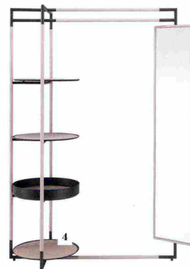
4. BAK VALET STAND DI FERRUCCIO LAVIANI PER FRAG. APPENDIABILI IN ACCIAIO RIVESTITO IN PELLE.