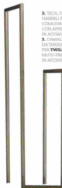
2. TECA, DI ALFREDO HABERLI PER QUODES. COMODINO CON APPENDIABILI IN ACCIAIO INTEGRATO. 3. CAMALEO, DISEGNATO DA THESIA PROGETTI PER TWILS. SERVO MUTO FREESTANDING IN ACCIAIO VERNICIATO