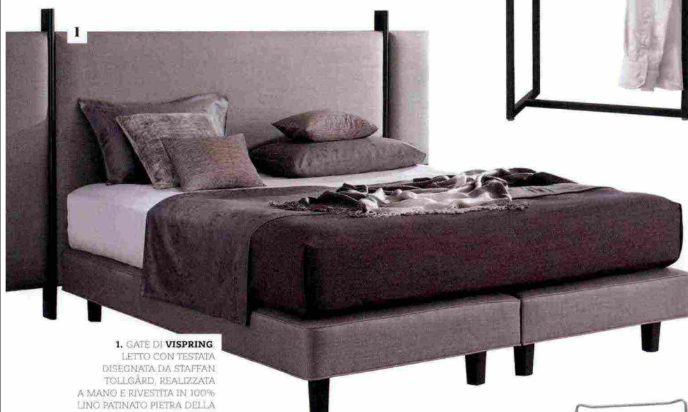
1. GATE DI VISPRING LETTO CON TESTATA DISEGNATA DA STAFFAN TOLLGÅRD, REALIZZATA A MANO E RIVESTITA IN 100% LINO PATINATO PIETRA DELLA ESCLUSIVA COLLEZIONE TIMELESS DEL BRAND INGLESE DI LETTI DI LUSO.