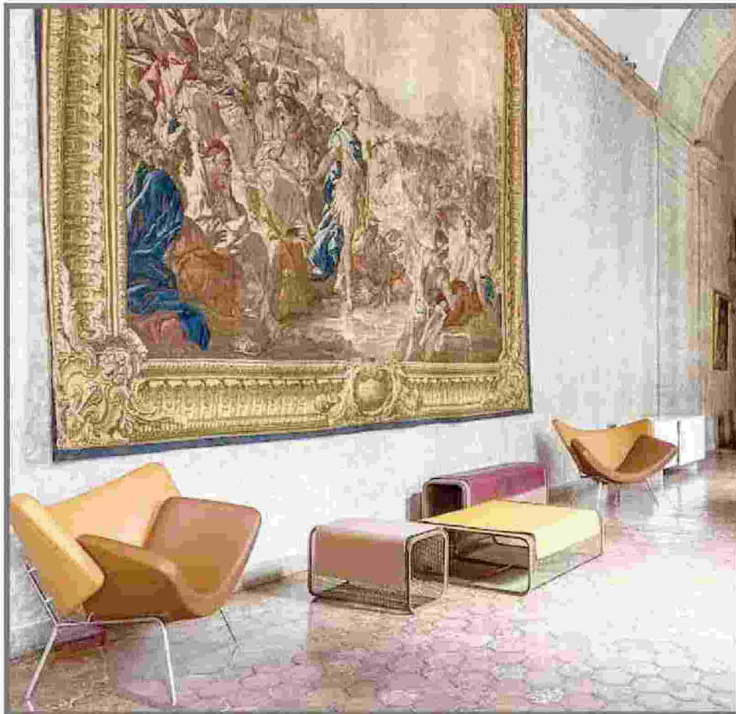
Stili e paesi a confronto Di Ghion le poltrone Butterfly Kiss prodotte da Sawaya & Moroni con le sedute Cabalito Blanco di Perkal (Oscarmaschera)

«Design@Farnese» è un cenno d'intesa Italia-Francia che entra anche sul piano artistico: «I francesi sono più moderati - dicono i galleristi - osano meno, hanno il timore d'essere vistosi anche nell'uso di materiali pregiati. Gli italiani di contro hanno idee innovative che spingono sull'estremo, sono più arditi. E il connubio fa bene a tutti. Con la crisi mondiale, si salvano i mobili sofisticati e di qualità ma anche innovativi. Tra i giovani funziona il mélange e non l'uniformità, si-