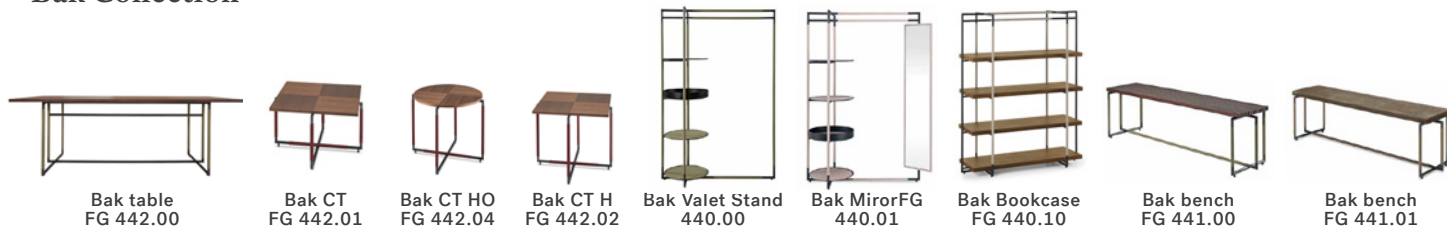
Bak table FG 442.00